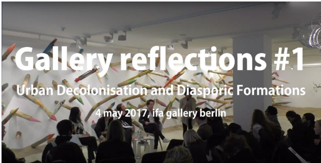
Figures 2–3 Screenshot of the YouTube documentation of gallery reflection #1 showing Pascale Martine-Tayou’s exhibition as part of chapter 1 »Global Relatedness« and gallery reflection #4 in ACUD, Berlin.